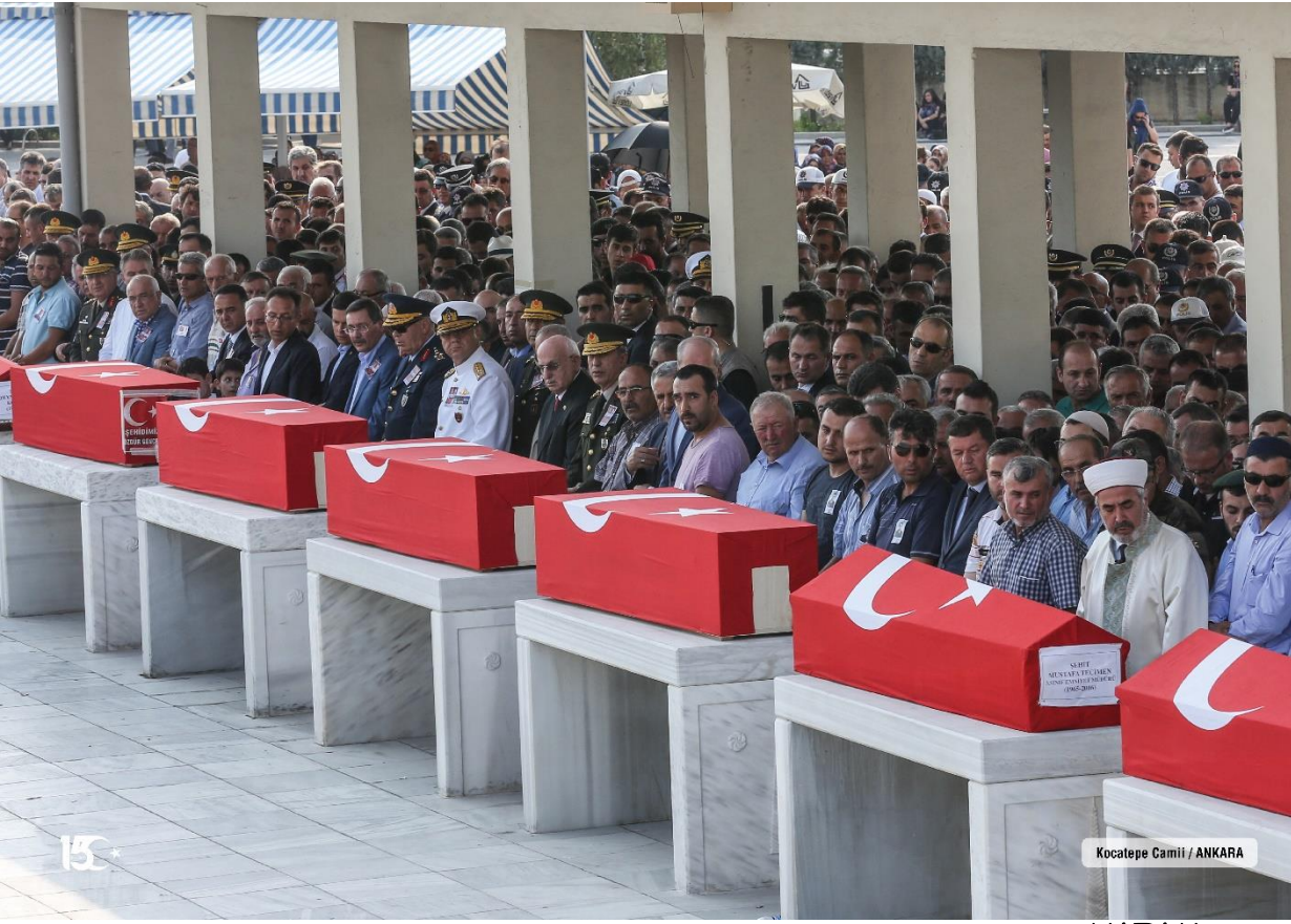
Kocatepe Camii / ANKARA